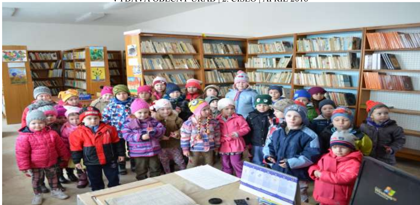
Deti z materskej školy na návšteve v obecnej knižnici

O DIANÍ V OBCI VEĽKÉ LOVCE VYDÁVA OBECNÝ ÚRAD | 2. ČÍSLO | APRÍL 2016