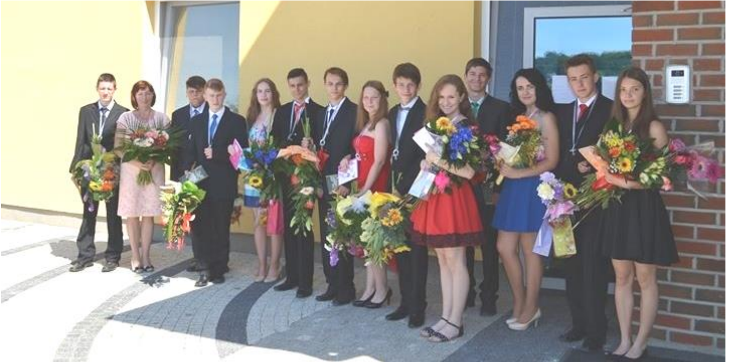
Deviatáci s triednou pani učiteľkou (už stredoškóláci)

O DIANÍ V OBCI VEĽKÉ LOVCE VYDÁVA OBEČNÝ ÚRAD | 3. ČÍSLO | AUGUST 2016